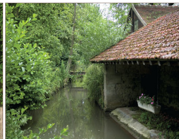
Lavoir du Carrouge