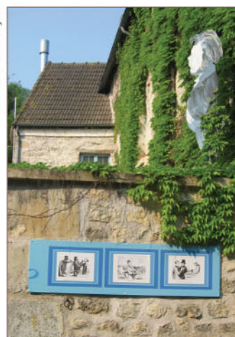
Caricatures de Daumier