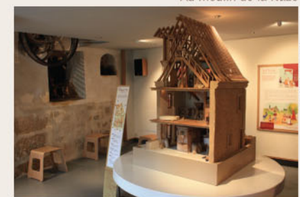
Au moulin de la Naze