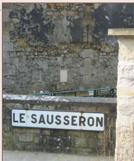
Pont sur le Sausseron, à Valmondois