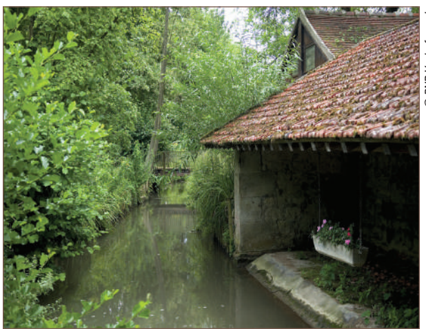
Lavoir du Carrouge