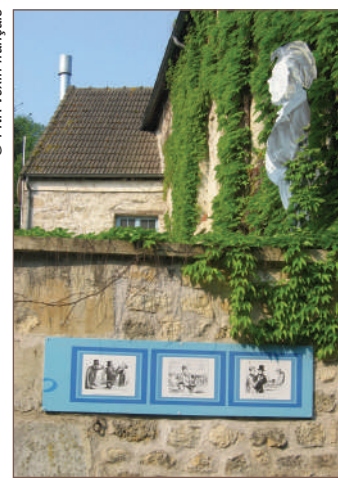
Caricatures de Daumier