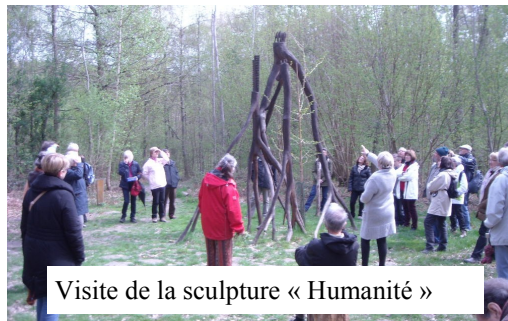
Visite de la sculpture « Humanité »

Il comporte onze stations dédiées à des thèmes consacrés à la philosophie, à la nature et à l'histoire locale. L'intention est de symboliser à terme chaque thème avec une œuvre de land art. Ainsi en 2009, la sculpture « Humanité » a été réalisée par l'artiste Michel Leclercq sur la station « L'homme et la nature ».