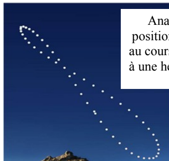
Analemme : positions du soleil au cours de l'année à une heure donnée

+ Ce cadran, conçu selon les techniques du land art, invite à une réflexion sur la délicate question de l'intervention humaine respectueuse de la nature.